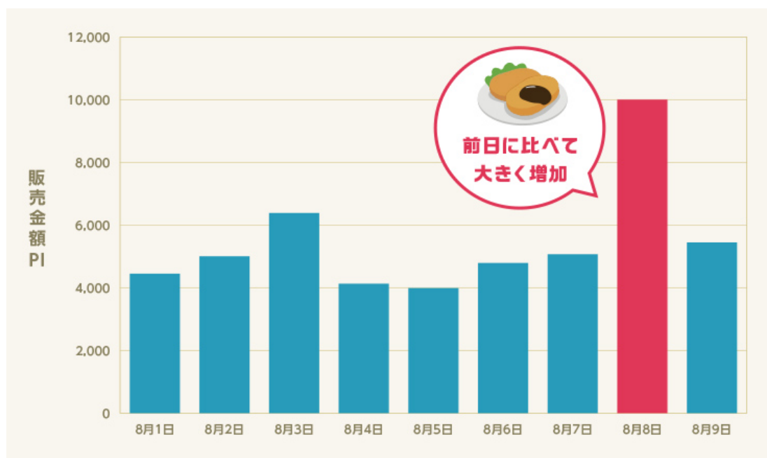
図表1 コロッケ惣菜の販売金額PI（関東地方）

すると、8月8日の販売金額PIは、前日に比べて大きく増加しました。前週の8月1日と比較しても大きく増加していることがわかります。